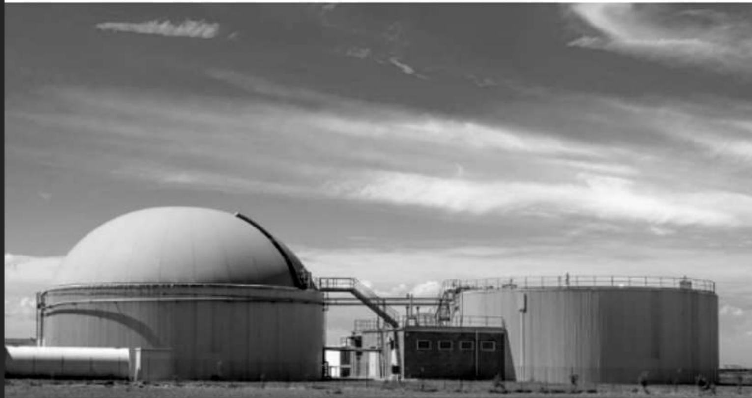
Une filière en plein développement : emploi et économie locale

La filière Biogaz, de 17 000 à 53 000 emplois à l'horizon 2030 ! https://lnkd.in/g9DBjti #environnement #transitionenergetique #biogaz #méthanisation #methane #EnR